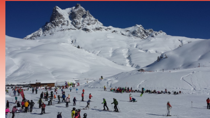
jährliche Ski- und Sprachlehrfahrten (z. B. Deutsch-Französische Begegnungen)

Hauptziel der Gemeinschaftsschule ist die individuelle Förderung der Schülerinnen und Schüler unabhängig von den angestrebten Schulabschlüssen.